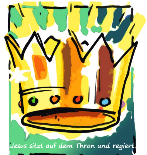
Jesus sitzt auf dem Thron und regiert.